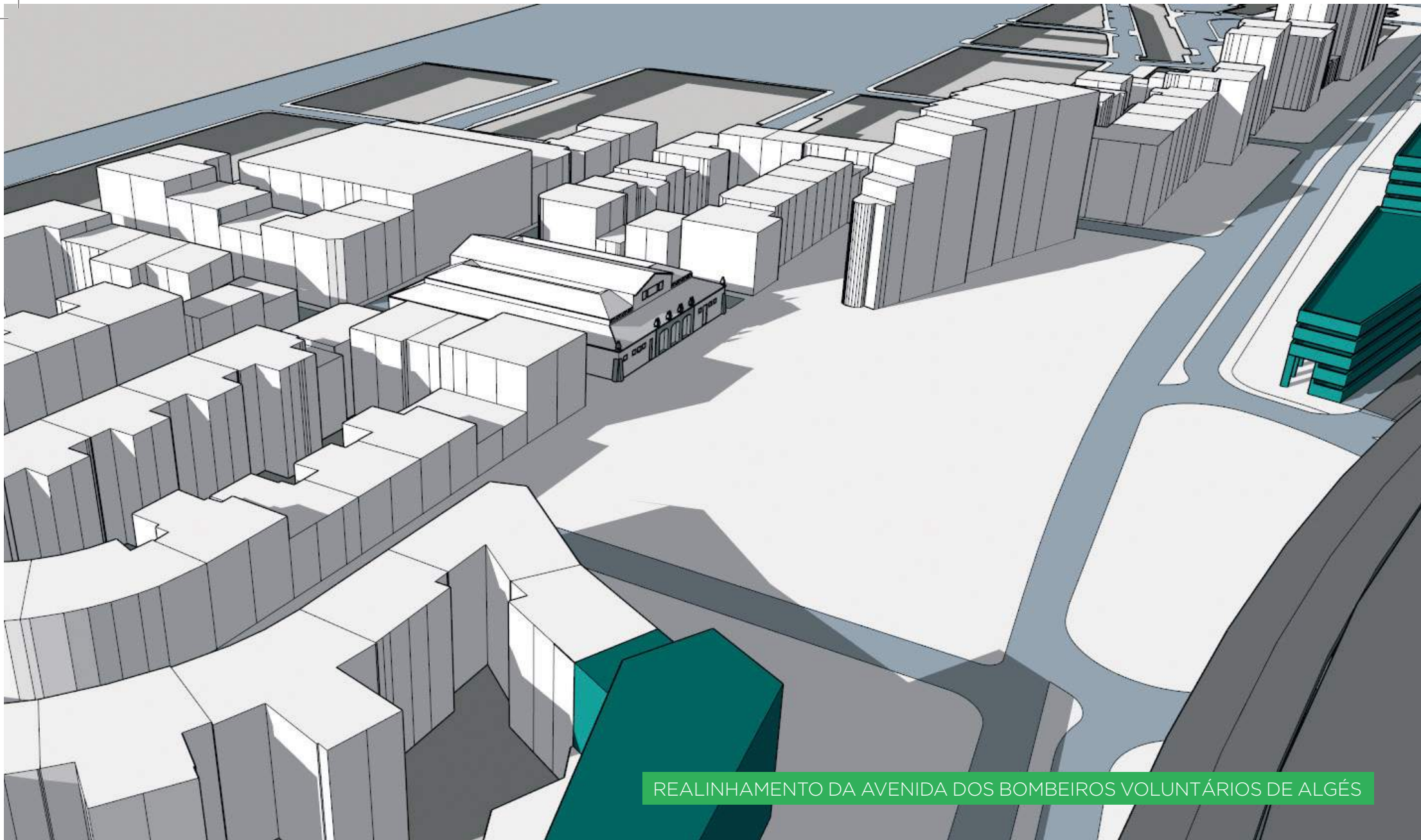
REALINHAMENTO DA AVENIDA DOS BOMBEIROS VOLUNTÁRIOS DE ALGÉS